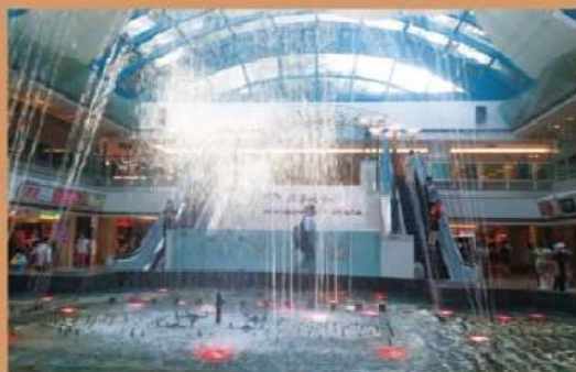
位於馬鞍山新港城中心，全港最後一個室內音樂噴泉本月正式被拆卸。

當時香港的建築多參照西方的廣場 (plaza) 和花園而建，但現在這種設計已經過時，因此新興建築很少再設有巨形、歐陸式的噴泉。阿鋒續指，噴泉一般難以打理，而且要長期供電，管理成本高昂，相信不論政府抑或商場都傾向讓它自然淘汰。「長年累月去打理一個噴水池很花功夫，現在坊間不少噴泉都是乾涸的，可能假以時日就會被拆卸。」