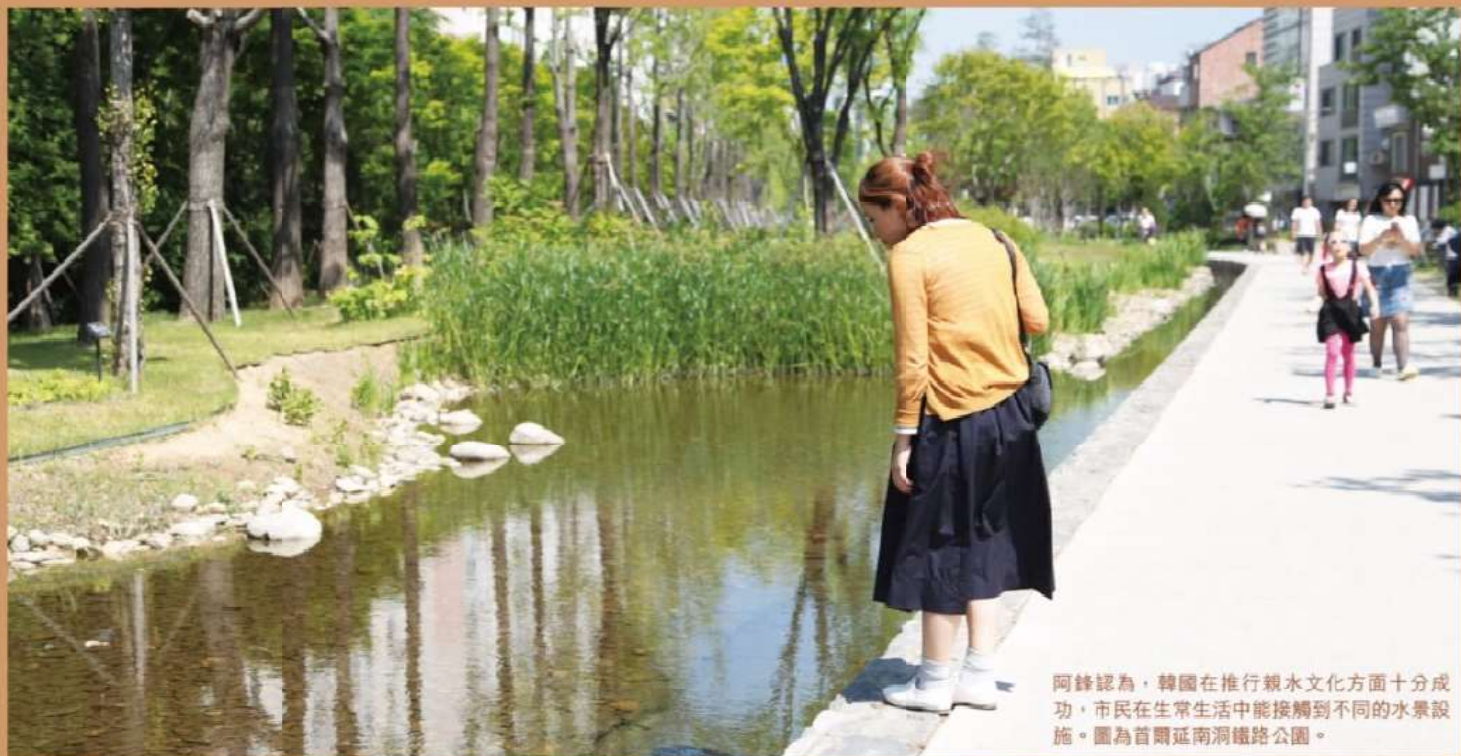
阿鋒認為，韓國在推行親水文化方面十分成功，市民在平常生活中能接觸到不同的水景設施。圖為首爾延南洞鐵路公園。